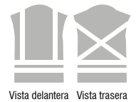
Vista delantera Vista trasera