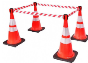
Cinta retráctil para conos